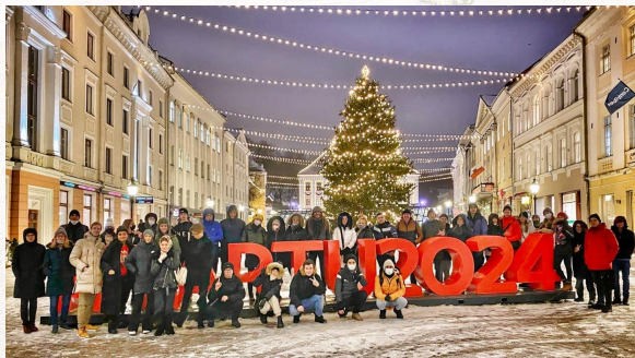
Erasmus 4 ESO