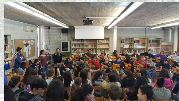
Mogudes 2 ESO