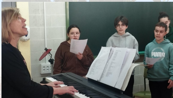
Taller de veu 1 ESO