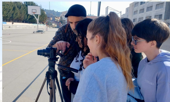
Cinema en curs 2 ESO