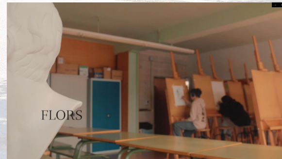
Cinema 1 BAT