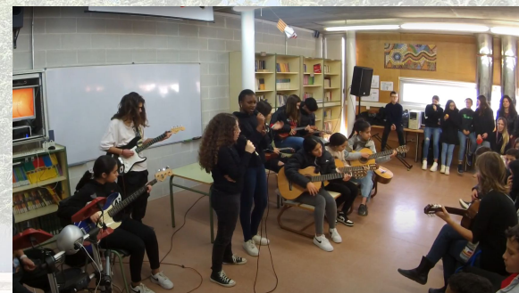
Mogudes 4 ESO