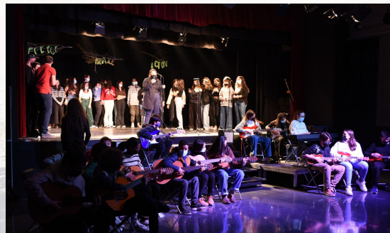
Arts escèniques 4 ESO