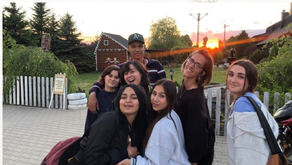
Erasmus 4 ESO