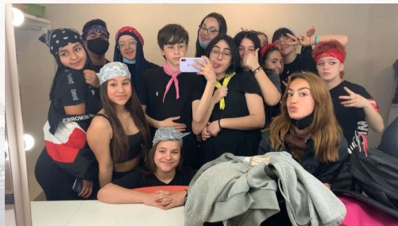
Fem Dansa 4 ESO