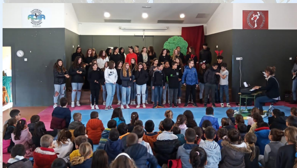
Arts escèniques 2 ESO