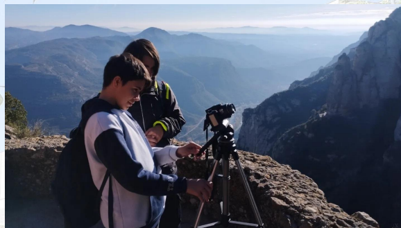
Cinema en curs 2 ESO